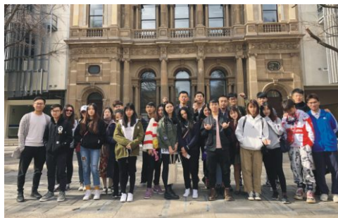
雅思团学生参观实践