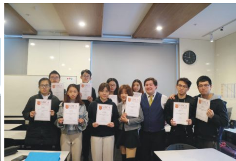
雅思团学生毕业合照