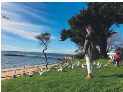
雅思团学生参观游览墨尔本