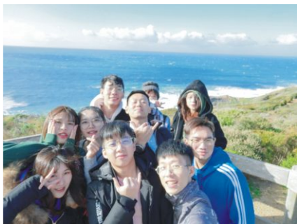
雅思团学生参观大洋路